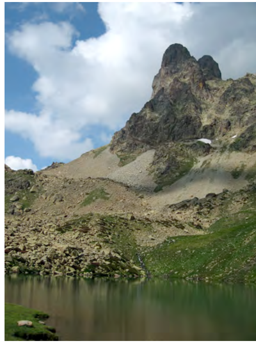
Pic du Midi d'Ossau